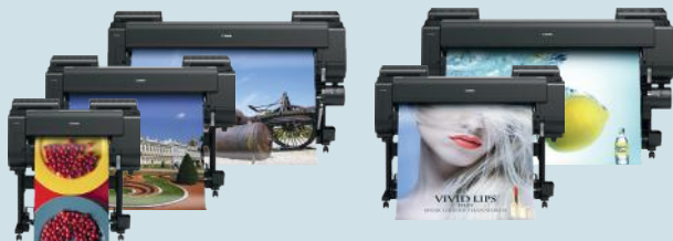
iPF PRO-/PRO-S-Serie - 24" (61,0 cm) - 60" (152,4 cm)