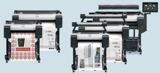
iPF TM-Serie - 24" (61,0 cm) - 36" (91,4 cm)