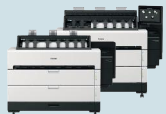
iPF TZ-30000 - 91,4 cm (36")