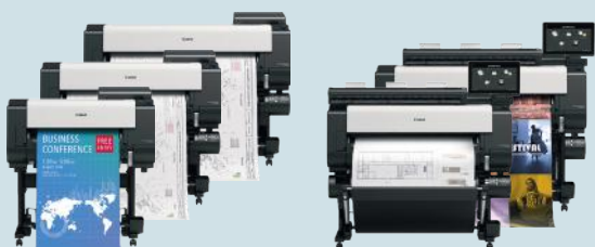
iPF TX-Serie - 24" (61,0 cm) - 44" (111,8 cm)