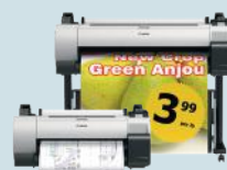
iPF TA-Serie - 24" (61,0 cm) - 91,4 cm (36")