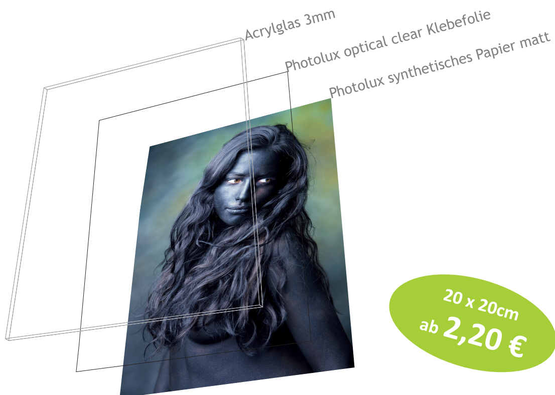
Bild hinter Acrylglas